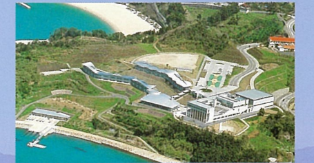
県立あしきた青少年の家