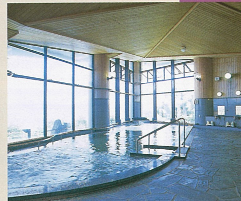
大浴場「夕映えの湯」