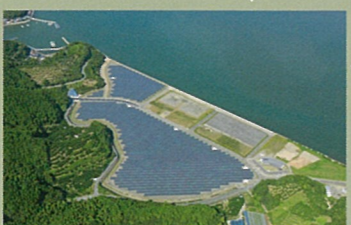
SGET 芦北メガソーラー