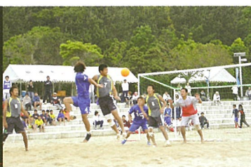
御立岬ビーチサッカー