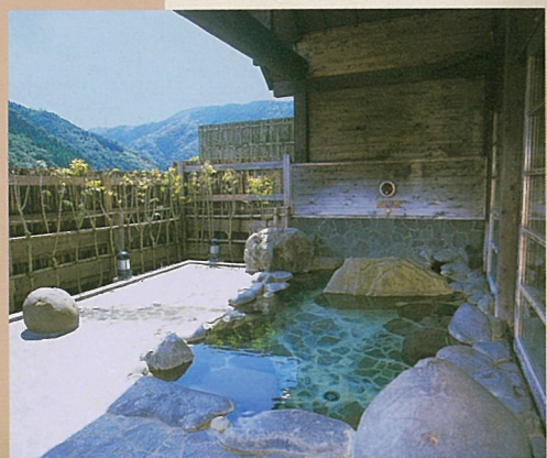
岩造りの露天風呂

町の山あいにある、昭和初期の懐かしい雰囲気漂わせた温泉施設で、大浴場は浴槽・仕切り板から湯桶に至るまで総ヒノキ造りです。岩造りの露天風呂やサウナ・打たせ湯のほか、五右衛門風呂・檜風呂・岩風呂の3種類の家族風呂もあり、お好みで楽しめます。アルカリ性単純温泉で神経痛や筋肉痛、冷え性、疲労回復などに効果があり、夜9時までゆっくり楽しめます。