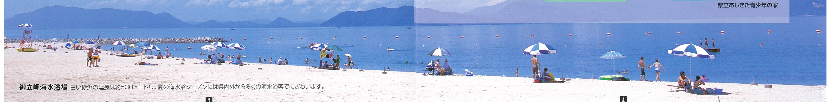
御立岬海水浴場 白い砂浜の延長は約530メートル。夏の海水浴シーズンには県内外から多くの海水浴客でにぎわいます。