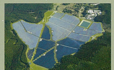
芦北太陽光発電所